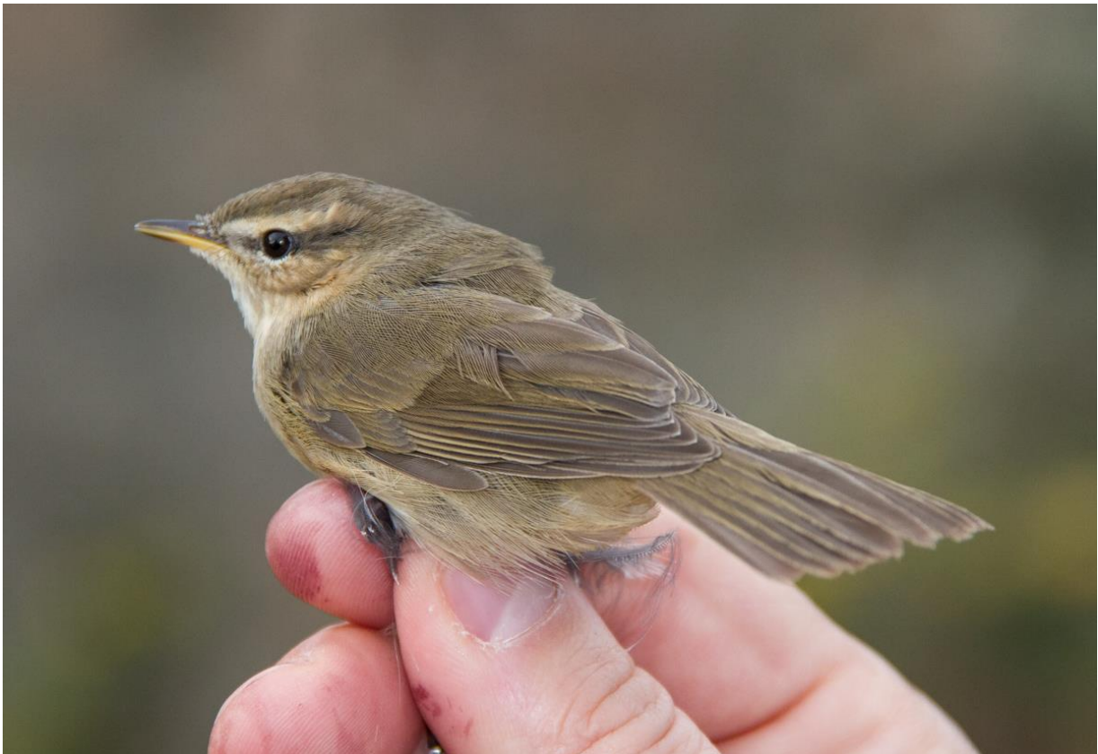
Ny art for stasjonen - brunsanger 30.10.2014