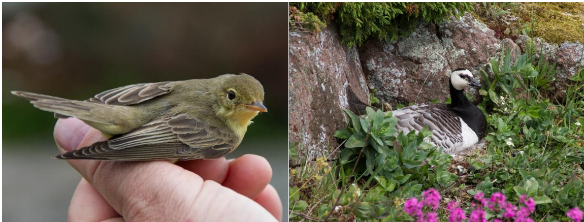
Gulsanger og rugende hvitkinngås 24. mai

Det ble ringmerket 1624 i mai og månedens beste dag var 12.5 med 211 ringmerkede fugler. Av mer uvanlige ringmerkede fugler hadde vi 2 sivsanger, 1 gjøk, 2 myrsanger, 2 rosenfink, 1 dvergfluesnapper, 1 myrrikse og hele 3 busksanger 22.5.