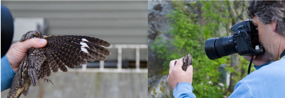
Nattravn havner også i ID fugl ved stasjonen