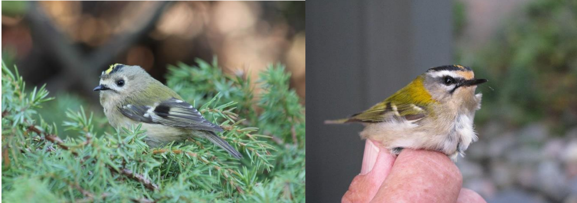
Den mest tallrike merkearten i 2014 (fuglekonge) og stasjonens femte rødtoppfuglekonge

Nok en måned med god dekning. Alle dager var bemannet. Dette ga også årets beste måned artsmessig med 109 arter registrert. Av de mange artene kan vi spesielt nevne 5 horndykker 11.9, 1 sivhauk 11.9, 1 myrhauk 6.9, 3 lerkéfalker 3+15+25.9, 1 trane 11.9, 2 lunde 26.9, 1 sein nattravn 9.9, 1 blåstjert (stasjonens tredje) ringmerket, 1 rødtoppfuglekonge (stasjonens femte) ringmerket og 1 båndkorsnebb 11+26.9.