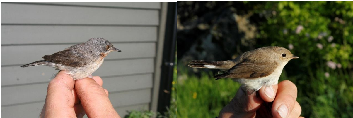
Rødstrupesanger og dvergfluesnapper ringmerket i juni

Det ble kun ringmerket 94 fugler i juni og de mest uvanlige var rødstrupesanger, dvergfluesnapper og hele 5 myrsanger.