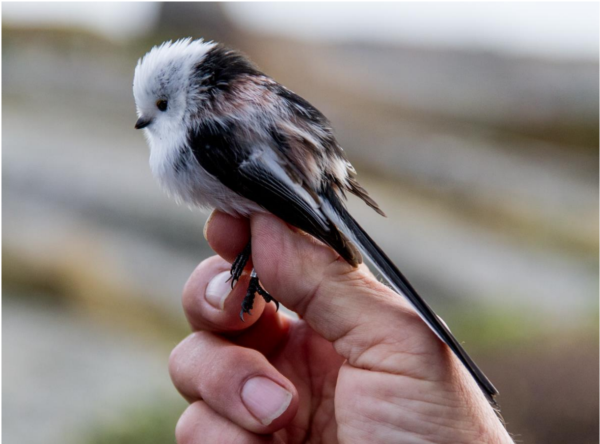
Ringmerket stjertmeis – alltid nydelige

Det ble ringmerket 1679 fugler i oktober. Beste merkedag var 3.10 med 210 individer. Av litt mer spesielle ringmerkede arter kan nevnes 2 spurvehauk, 1 perleugle 21.10, 1 stillits 29.10, 7 bergirisk 29.10, 2 brunsvanger 30.10 og 1 sein ringtrost 31.10.