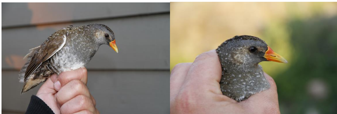
Stasjonens første myrrikse