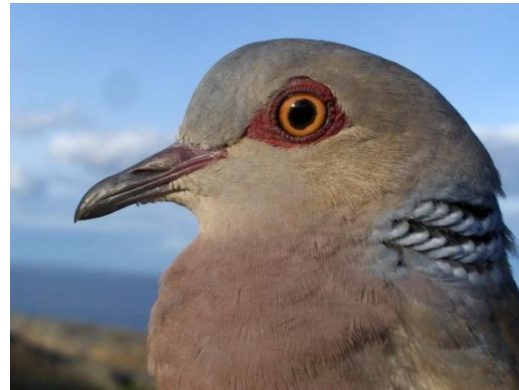
Turteldue ringmerket på Store Færder 13/5. Et av høydepunktene i 2009.