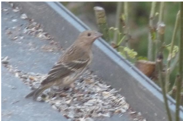
Rosenfink på fuglebrettet 22-23/9.