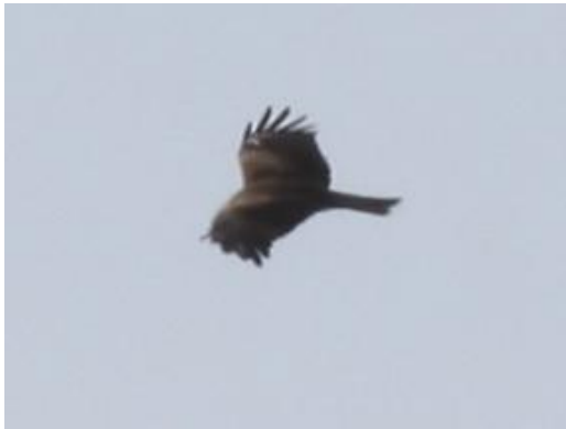
Svartglente på Store Færder 3/5. Et av høydepunktene i felt 2009.

bokfinkene var hunner. Det ble satt et minimums antall i loggen på 5000, men trolig var det langt flere som besøkte øya denne dagen i tillegg til minimum 500 jernspurv. Andre halvdel av april hadde stasjonen besøk av tre engelskmenn, John McEachen, Paul Nicholas Thorpe og Chris Hansell, i tillegg til helgebesøkende. Av høye antall og spesielle observasjoner fra denne perioden kan nevnes 134 storspove 18/4, 3 trane 18/4, lerkéfalk 19/4, 24/4 og 25/4, 1 nøttekråke 27/4, 1 tyrkerdue 28-30/4, 3 fiskeørn 30/4 og første syngende nattergalen 30/4.