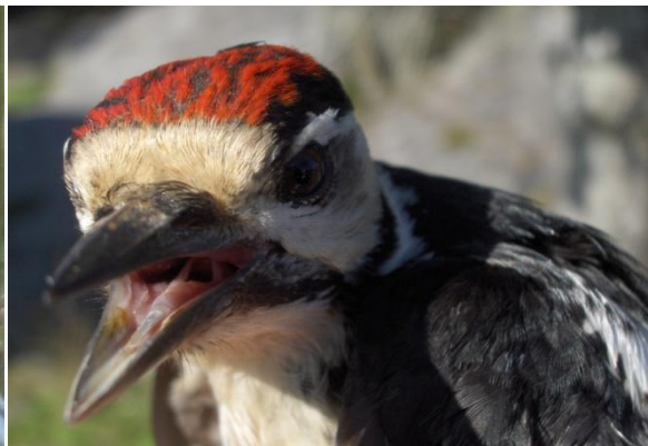
12 flaggspett fikk ring i 2009.